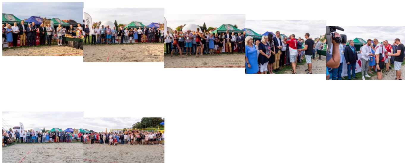
Tekst. J. Faber