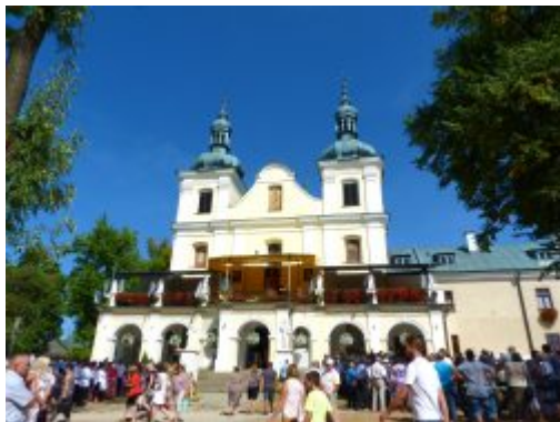
fot. Zdzisław Szeliga