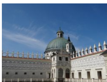
Zespół Zamkowy – Parkowy w Krasicy