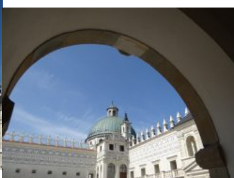
Zespół Zamkowy – Parkowy w Krasicy