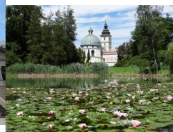
Zespół Zamkowy – Parkowy w Krasicy

Zamek w Krasicy należy do najcenniejszych pomników architektury w Polsce. Zwany perłą renesansu; zabytek klasy „O”.