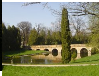
Zespół Zamkowo - Parkowy w Krasiczynie