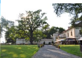
Zamek Dubiecko