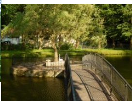
Zamek Dubiecko