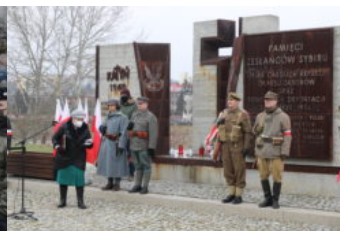
81. rocznica deportacji Polaków na Sybir w Przemysłu