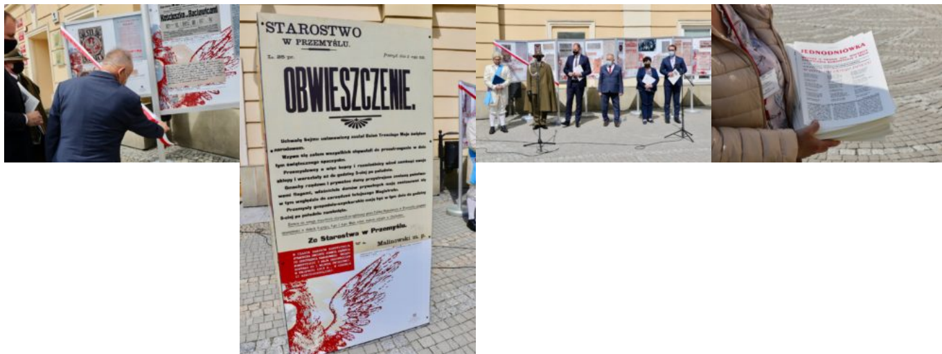
oprac.: M. Dachnowicz