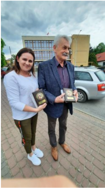
Relację nadesłała Agata Lalik