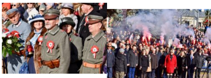
Oprac.: M. Dachnowicz