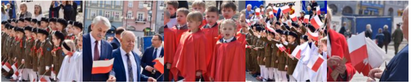
URZĄD MIEJSKI W PRZEMYSŁO