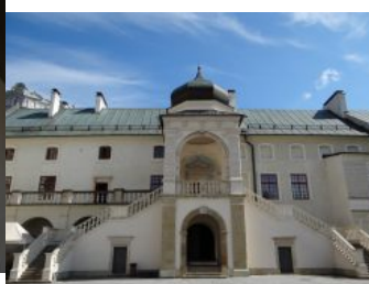
Zespół Zamkowy – Parkowy w Krasicy