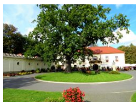
Zamek Dubiecko

W Dubiecku urodził się biskup Ignacy Krasicki – „książę polskich poetów” oraz słynny awanturnik – Stanisław Stadnicki, zwany „diabłem łańcuckim”. Obiekty, które warto obejrzeć to: jeden z najstarszych sakralnych obiektów architektury drewnianej – modrzewiowy kościół w Bachórcu /1760 – 1763/, cerkwie w Piątkowej i Dubiecku, zespoły pałacowo-dworskie w Nienadowej, Bachórcu i Wybrzeżu oraz zamek w Dubiecku z XVI w., a w nim Muzeum Biograficzne Ignacego Krasickiego.