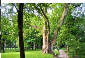
Zamek Dubiecko