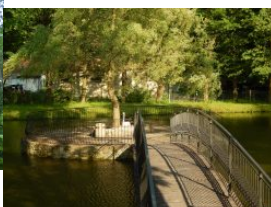
Zamek Dubiecko