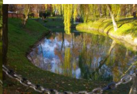
Zamek Dubiecko