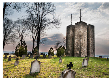
Staszkówka Nr 118