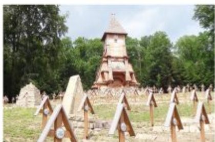
Łużna Pustki nr 123