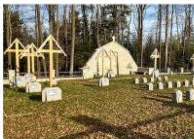
Biesna Nr 121