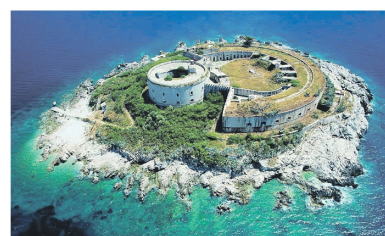
SYSTEM AUSTRO - WĘGERSKICH FORTYFIKACJI W ZATOCE KOTORSKIEJ