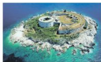
SYSTEM AUSTRO - WĘGIERSKICH FORTYFIKACJI W ZATOCE KOTORSKIEJ