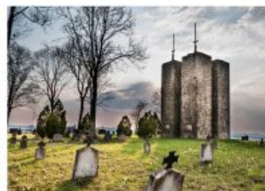
Staszkówka Nr 118