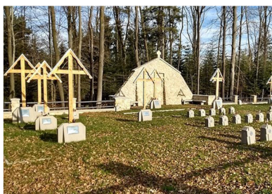
Biesna Nr 121