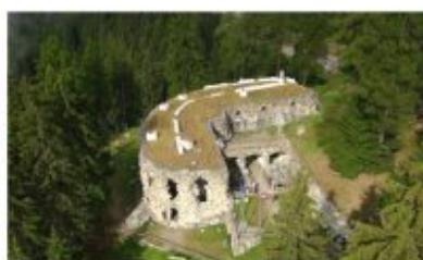
TRYDENT Z RYGLEM FOLGARIA - LAVARONE