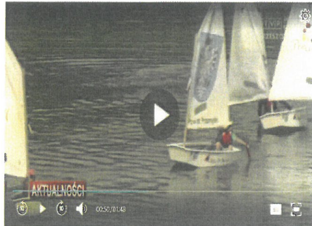
Wakacje pod znakiem regat na Jeziorze Solińskim